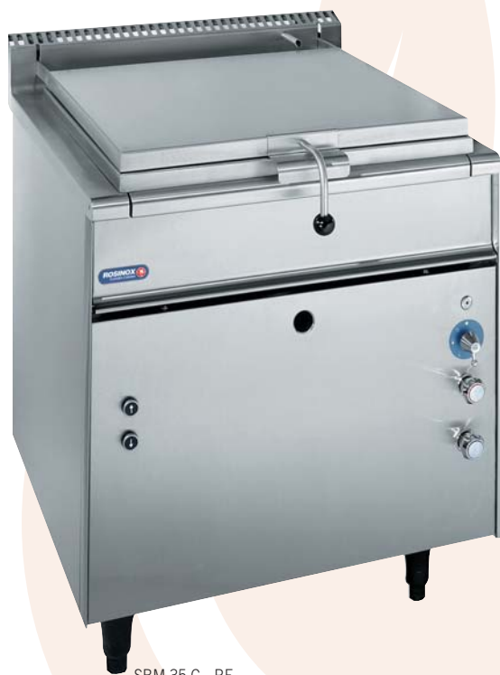
SBM 35 G - RF

Quemadores-rampas (2, 4 et 6 sobre los modelos 35, 50 y 80 dm 2 respectivamente) en acero inoxidable, comandadas por un grifo a 4 posiciones con dispositivo de seguridad por termopar y piloto. Encendido eléctrico por tren de destellos.