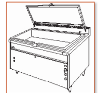
SBM 80 G - RF SBM 80 E - RF