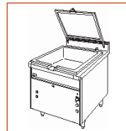
SBM 35 G - RF