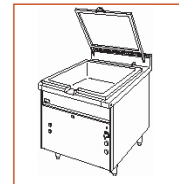
SBM 50 G - RF SBM 50 E - RF