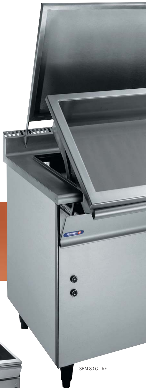
SBM 80 G - RF