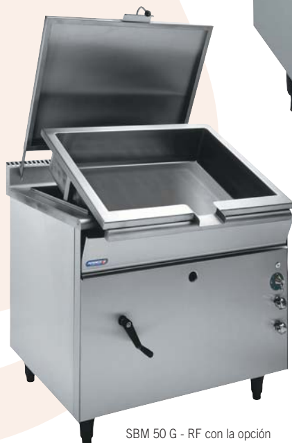
SBM 50 G - RF con la opción basculación manual